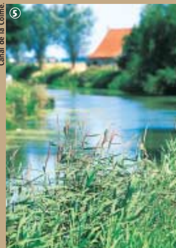
Canal de la Colime.

La satisfaction fut cependant de courte durée : dès 1646, pour des raisons militaires, la région fut à nouveau inondée et le chef-d'œuvre de Coeberger réduit à néant.