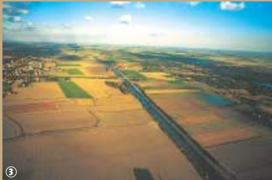
La plaine maritime.

rieur des Moères, le Ringsloot, qui avait la particularité d'avoir le fond plus élevé que les marais et le niveau de la mer à marée basse. L'ingénieur érige ensuite 23 puisants moulins près de sa digue. Au moyen de vis sans fin en chêne, ils pompaient l'eau dans les marécages et les rejetaient dans le Ring-