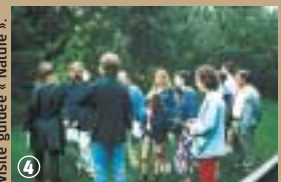
Visite guidée « Nature »

cette variété de pomme en tige. Des ateliers de greffe et de taille des fruitiers sont aussi organisés. Car le Puythouck est avant tout un lieu de contact et d'échanges avec la nature et tout au long de l'année, des animations rapprochent l'homme et son environnement.