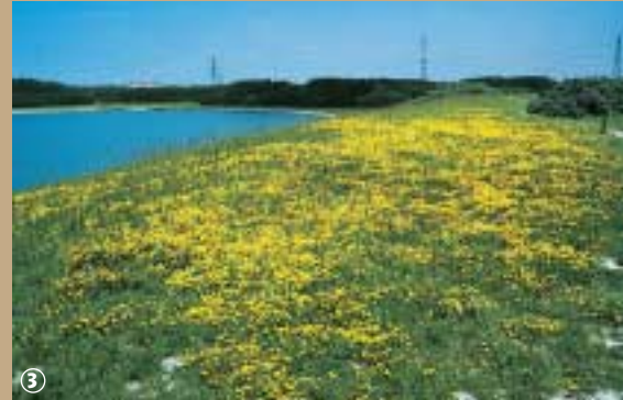
Buttes sableuses, Puythouck

Ce retour à la nature s'accompagne aussi d'une initiation à la