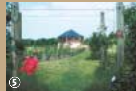
Verger du Puythouck

culture des fruits. Sur deux hectares, le verger pédagogique rassemble des essences d'arbres fruitiers communes et d'autres plus insolites comme la Belle Fleur Double,