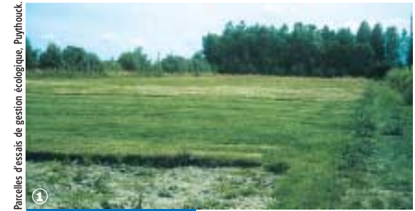
Parcelles d'essais de gestion écologique, Puythouck