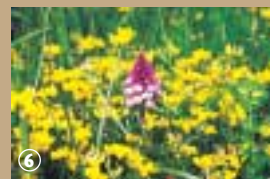
Orchis Pyramidal parmi les fleurs de lotier.

renciée repose sur un principe fondamental : valoriser le parc par des méthodes d'entretien, plus en adéquation avec la nature, notamment en favorisant le développement de la faune et de la flore sauvage. L'emploi de traitement