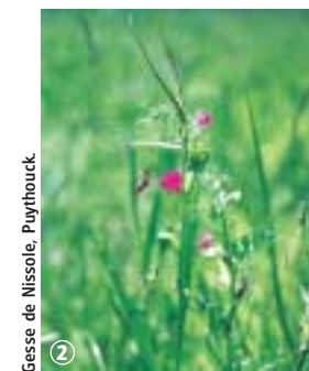
Gesse de Nissolle, Puythouck