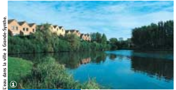
L'eau dans la ville à Grande-Synthe.