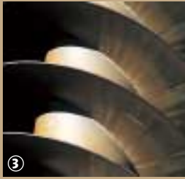
Vis sans fin.

Petite leçon de vocabulaire pour commencer : « water » signifie « eau » et « ring » « cercle ». Mais d'une façon générale, les waterings désignent l'ensemble des terres compris dans le triangle Saint-Omer, Calais, Dunkerque, correspondant à l'ancien delta de la rivière l'Aa. Aujourd'hui c'est une vaste plaine maritime de 85 000 ha dont le niveau moyen des terres est inférieur au niveau moyen de la mer.