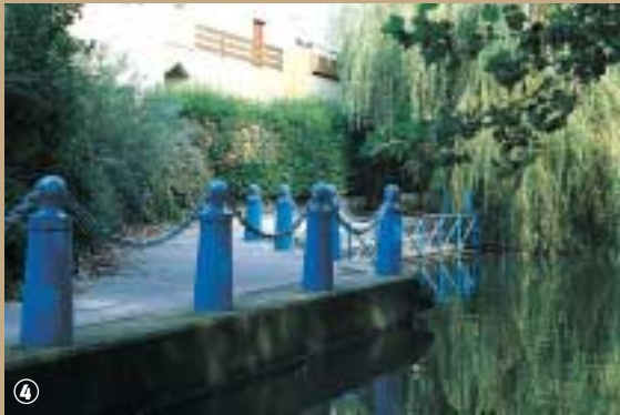
L'eau dans la ville à Grande-Synthe.

(quatre dans le Nord et neuf dans le Pas-de-Calais). Ce sont des associations forcées de propriétaires qui entretiennent plus de 1 500 km de watergangs et environ une centaine de stations de pompage.