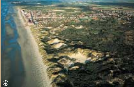
Massif Dumaire, vue aérienne.

oiseaux, tels la mésange et la fauvette, qui peuplent les argousiers, troènes et sureaux, semblent plutôt y voir la vie en rose. Lorsque que