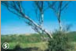
La dune boisée.

naire, soumise au vent et aux embruns salés, sert de bouclier à la dune blanche, mais ponctuée de faisceaux verts : ce sont l'oyat, l'euphorbe des dunes et l'élyme des sables qui fixent la dune et tiennent compagnie à de drôles d'oiseaux, le cochevis huppé et le pipit farlouse. L'éventail de couleurs se poursuit avec la dune grise, qui porte mal son nom, car dès la première pluie, la mousse tortue d'aspect noir qui la recouvre, se transforme en un tapis vert fluorescent. Les nombreux