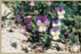
Pensée des dunes.

Le rivage nordiste a la particularité d'être parallèle aux vents d'ouest, ce qui a pour effet la constitution de massifs dunaires peu élevés (20 m) caractéristiques de la Côte flamande. Pour les habitués du bord de mer, la dune n'est qu'une colline de sable. En réalité, l'espace dit dunaire se décompose en sous-ensemble, grouillants de vie. Face à la mer, la dune embryon-