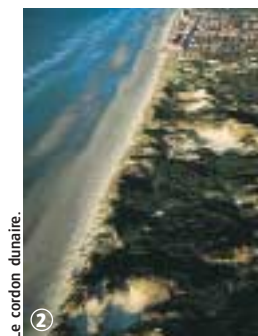
Le cordon dunaire.