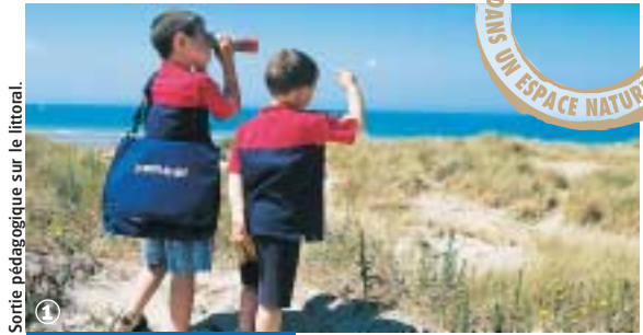
Sortie pédagogique sur le littoral.

Randonnée Pédestre Circuit de la Dune Dewulf : 6 km