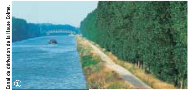
Canal de dérivation de la Haute Colme.