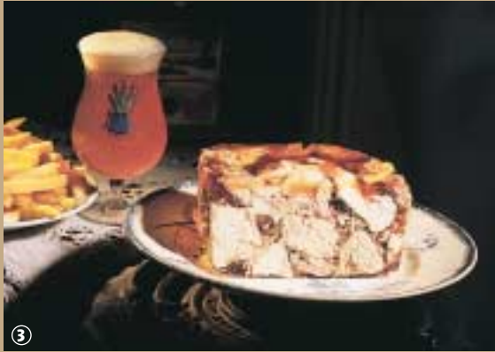
Le Potje vleesch.

litre d'eau, de vinaigre et de vin blanc mêlée d'une poudre de gelée. La cuisson dure trois à quatre heures, avant de laisser refroidir pour laisser prendre la gelée une douzaine d'heures environ. Le plat, une fois confiné, se sert avec des spécialités locales, frites