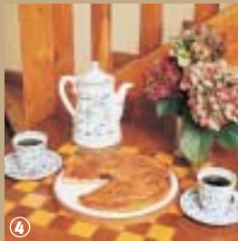
La fameuse tarte au sucre...

ou pommes vapeur, accompagné d'une autre célébrité : la bière. Astuce d'un grand chef qui a tenu à garder l'anonymat : la poitrine de porc, le lapin et les cuisses de poulet doivent avoir exactement le même poids. Le Nord gastronomique c'est une grande richesse de plats et de desserts tous aussi succulents que différents. Bon appétit !