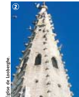
Eglise de Looberghe.