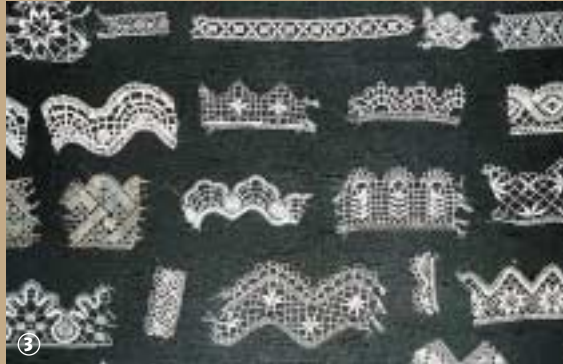
Bailleul : la dentelle.

fuseaux et leurs fils. Le reste est une question de doigté : le dessin en papier se chrysalide en un chef-d'œuvre de tissu formé de lin, de coton, de soie, d'or ou d'argent. L'art de la dentelle s'est transmis de génération en génération du XV e siècle jusqu'à nos jours, grâce aux écoles qui formaient des jeunes filles dès leur plus jeune âge, à la réalisation des dentelles les plus belles et les plus variées. L'école de dentelle de Bailleul accueille enco-