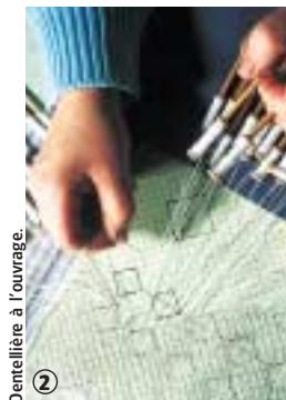
Dentellière à l'ouvrage.

Ce circuit s'adresse au promeneur et à la famille dans sa version courte, au randonneur averti dans sa version longue. Le circuit 10 km est entièrement macadamisé. Il est donc praticable, à pied sec, toute l'année. Le dénivelé cumulé positif pour le circuit 14 km est d'environ 125 m.