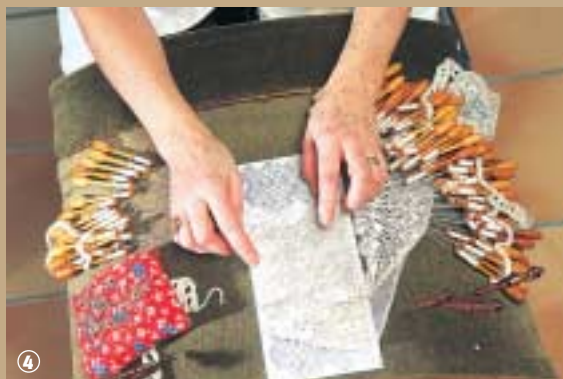
École de dentellières.

re aujourd'hui plus de 150 élèves de 6 à 99 ans qui s'initient aux techniques de la dentelle. En l'honneur de cet art qui fait la renommée de la ville, la municipalité de Bailleul organise tous les trois ans les Rencontres Internationales de la Dentelle, c'est l'occasion de perpétuer la tradition.