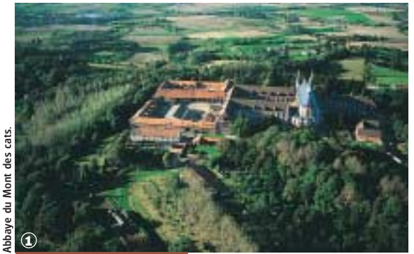
Abbaye du Mont des cats.