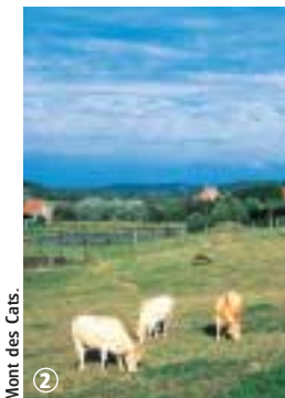
Mont des Cats.