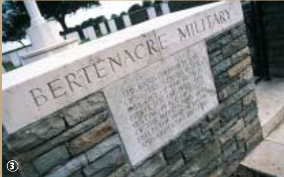
Cimetière anglais à Godewaersvelde.

En 1917, est créé le cimetière britannique de Godewaersvelde. La même année, une Commission des sépultures de Guerre du Commonwealth a la mission de gérer la constitution de monuments commémoratifs, à la mémoire de ceux qui n'ont pas de sépulture et l'entretien des cimetières, selon les principes d'uni-