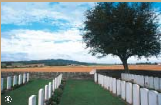
Cimetière anglais à Godewaersvelde.