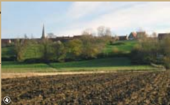
Au pied du talus de Merckeghem.

de la côte, on se trouve parfois au niveau de la mer. Les Flamands se mirent avec ténacité à la conquête des terres qu'ils asséchèrent et si, au X e siècle, la partie nord de la Flandre maritime est presque hors d'eau, de Bourbourg à Watten, le paysage n'est encore qu'un vaste marécage. Les derniers vestiges des marais, au pied du talus, portent à Merckeghem le nom « Eekhout », bois de chêne ou « Les Vives ». Là, se tenait dit-on au V e siècle, une petite ville très riche : Eeck, qui fut noyée par les eaux. Un jour, on sonda l'étang : la corde descendit à 300 m sans toucher le fond ! Depuis, les cloches de la cité noyée, résonnent la veille des grandes catastrophes. Le long de la route des Crêtes, les légendes et les croyances sont, paraît-il, encore vivaces !