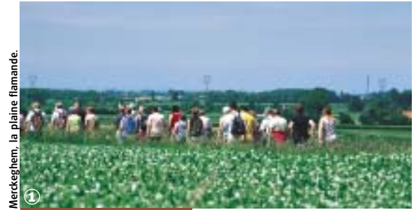
Merckeghem, la plaine flamande.

Bocage Flamand et marais Audomarois, au fil de l'Yser