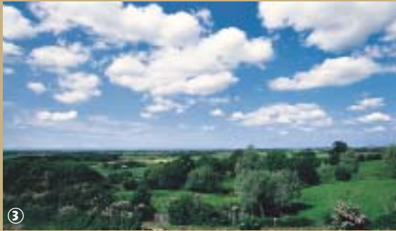
Merckeghem, vue depuis le haut de l'ancien talus maritime.

Dessinez sur une carte une ligne reliant Watten à Quaëdyre, en passant par Millam, Merckeghem, Bollezele, Zegerscappel, Pitgam et observez les courbes de niveau rapprochées et les points d'altitude élevés. Ce tracé indique tout simplement la limite entre la Flandre maritime et la Flandre des Monts. A une époque, pas si éloignée que cela, aux IV e et V e siècles de notre ère, toute la Flandre maritime, en raison d'une remontée du niveau de la mer, due à la transgression dunkerquienne, est envahie par les eaux, buttant sur quelques collines qui émergeaient, comme à Merckeghem. Ce village est situé sur le talus maritime. Le Galberg (Mont du Gibet) couvert d'un bois, monte à 61 m d'altitude et constitue l'un des plus jolis points d'observation de la plaine ; d'ailleurs au pied de Merckeghem, à 20 km