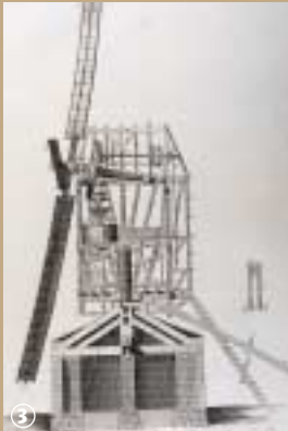
Moulin à vent.

Avant les bouleversements de la Révolution industrielle, les moulins étaient pratiquement les seuls producteurs d'énergie. Ils servaient principalement à broyer les céréales et à la fabrication de l'huile. La Flandre, qui bénéficiait du souffle des vents dominants de secteur ouest, fut la terre des moulins à vent. Ils faisaient partie intégrante du paysage, au même titre que les églises. Pour la plupart, il s'agissait de moulins sur pivot. D'une manière générale, ils se