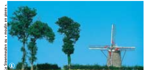
Le Steenmeulen ou « moulin en pierre ».

Randonnée Pédestre La Ronde des Moulins : 9,5 km