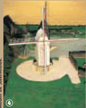
Moulin de Steenvoorde.

l'avoine. Un escalier très solide, servant d'appui lors des tempêtes, permet d'y accéder et d'en extraire la marchandise. Le poids total de l'ensemble, avec les ailes, supporté par le pivot, avoisine les 35 tonnes. L'ennemi juré du moulin, outre le feu, est l'humidité, provoquant la pourriture du bois. Alliée à l'obscurité, elle pouvait occasionner l'apparition d'un champignon redoutable, le mérélu. Une bonne aération était donc obligatoire pour garantir la qualité du blé et la pérennité du moulin. Aujourd'hui une vingtaine de moulins à vent subsistent dans le Nord, alors qu'on en recensait 2000 au XIX e siècle. La plupart sont visitables, ayant été tous réhabilités, selon conditions, et font revivre les savoir-faire d'autrefois.