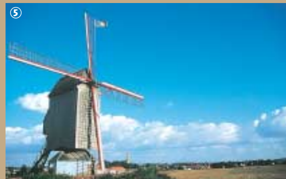
Le Noormeuken ou « moulin du Nord ».

composent d'un piédestal fixe supportant une cage qui pivote, afin de placer les ailes face au vent. Les moulins à pivot sont composés de deux greniers : celui du haut abrite les meules ; celui du bas s'occupe de réceptionner la farine et gère les opérations de blutage c'est-à-dire de séparation du son de la farine et d'aplatissement de