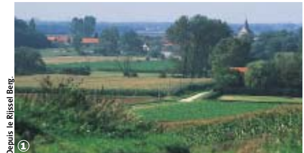
Depuis le Rijssel Berg.

Bocage Flamand et marais Audomarois, au fil de l'Yser