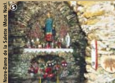
Notre-Dame de la Salette (Mont Noir).

taient aux agriculteurs de se recueillir sans avoir à se déplacer jusqu'à l'église. Héritières sans doute du paganisme, elles sont depuis dédiées à la Vierge et aux Saints, liées à la commémoration d'un événement ou le plus souvent associées aux miracles. Ainsi la chapelle de la Cloche à Zegerscappel, est dédiée à Saint Bonaventure. Ce dernier, docteur appartenant à l'ordre de Saint-François, mort en 1274 et canonisé par décret du pape Sixte IV,