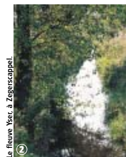
Le fleuve Yser, à Zegerscappel.