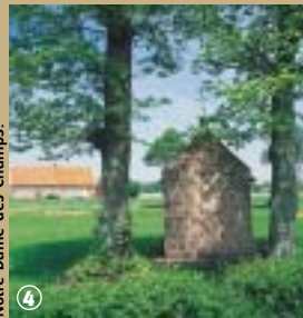
Notre-Dame des Champs.

taient aux agriculteurs de se recueillir sans avoir à se déplacer jusqu'à l'église. Héritières sans doute du paganisme, elles sont depuis dédiées à la Vierge et aux Saints, liées à la commémoration d'un événement ou le plus souvent associées aux miracles. Ainsi la chapelle de la Cloche à Zegerscappel, est dédiée à Saint Bonaventure. Ce dernier, docteur appartenant à l'ordre de Saint-François, mort en 1274 et canonisé par décret du pape Sixte IV, aurait été invoqué par le marin Michel Thomas, désirant sortir vivant d'une tempête en Méditerranée. Son vœu exaucé, il aurait construit la chapelle vers 1350 sur le domaine familial au lieu-dit « hameau de la Cloche ». Les fidèles viennent encore servir le Saint, particulièrement invoqué contre les rhumatismes et les maladies contagieuses et incurables, au moment de la neuvaine entre le 14 et 22 juillet. Les reliques du Saint Patron qui reposent toute l'année dans la paroisse, retrouvent durant cette période, leur place originelle au sein de la chapelle. Zegerscappel abrite également une chapelle édifiée à des fins funéraires. Il s'agit de la chapelle Bertin-Denys, du nom d'un ébéniste qui avait fait le vœu de reposer dans la chapelle qu'il avait lui-même bâtie, à l'arrière de la ferme du Sprey.