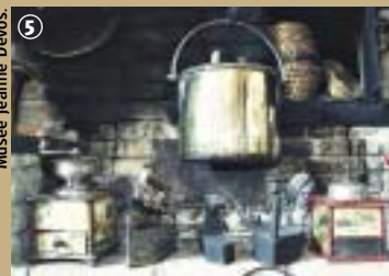
Musée Jeanne Devos.

Décidément l'on resterait bien encore 5 mn... !