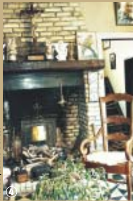
Musée Jeanne Devos.

Si l'envie vous dit de vous remémorer quelques vieux souvenirs, de partager la vie de vos aïeux ou plus simplement de découvrir la vie quotidienne des Flamands au siècle dernier, « Le temps d'une pause pendant la cueillette du houblon », « A l'entrée de la