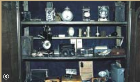
Musée Jeanne Devos.

Si l'envie vous dit de vous remémorer quelques vieux souvenirs, de partager la vie de vos aïeux ou plus simplement de découvrir la vie quotidienne des Flamands au siècle dernier, « Le temps d'une pause pendant la cueillette du houblon », « A l'entrée de la