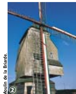
Moulin de la Briarde.