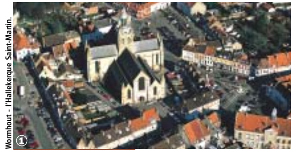
Wormhout - l'Hallekerque Saint-Martin.

Bocage Flamand et marais Audomarois, au fil de l'Yser