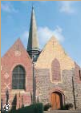
Eglise à Ochtezeele.