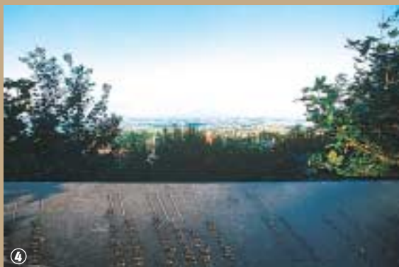
Table d'orientation de Cassel.

Contrairement aux idées reçues, les voies n'étaient pas construites en pavés ; les Romains utilisaient les matériaux locaux, notamment du grès ferrugineux, des galets de mer et du gravier. Retrouver aujourd'hui cette étoile à sept branches au sommet du Mont Cassel, mais attention de ne pas les confondre avec les nouvelles routes départementales !