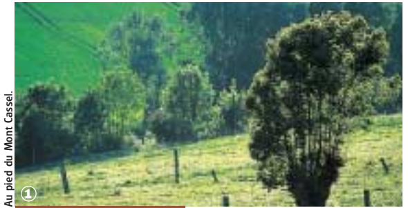
Au pied du Mont Cassel.