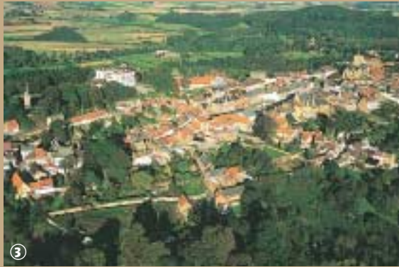
Vue aérienne de Cassel.

visionner en sel et produits de la mer ; la seconde voie menait à Mardrick et la troisième à Boulogne via Watten. La quatrième conduisait à Théroutanne avec un embranchement vers Saint-Omer, tandis que la cinquième rejoignait la Lys. La sixième voie en direction de Caëstre, permettait de relier Arras, Tournai, Bavay, Cologne, Lyon et Reims. La septième et dernière voie conduisait à Bruges.