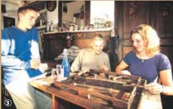
Estaminet : jeux traditionnels.

Dans ces campagnes flamandes où l'habitat était dispersé, l'estaminet servait de point de ralliement. Il faisait bon s'y réchauffer au coin du poêle à bois ou de profiter du vierpot, le pot à braise, pour allumer sa pipe ; d'ailleurs littéralement l'estaminet c'est le café où l'on fume.