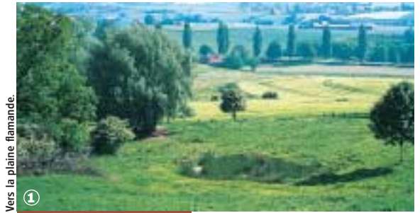
Vers la plaine flamande.

Cassel, Oxelaëre, Ste-Marie-Cappel, St-Sylvestre-Cappel, Terdegheem, Steenvoorde (18 km - 4 h 30)