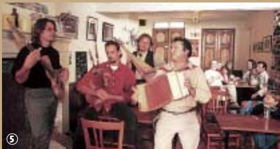
Estaminet Kereishof à Cassel.

tout ce qui roule, balle ou boule. Le principe est finalement toujours le même : gagner. Mais ici aucune rivalité, juste du plaisir. D'ailleurs, des passionnés se sont fait une spécialité de les restaurer, pour notre bonheur à tous... !