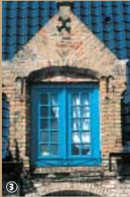
Panne flamande vernissée.

Levez les yeux vers le ciel et observez attentivement les toits de ces maisons flamandes. Ils ont cette particularité typique au Nord de la France, d'être recouverts de tuiles en forme de S. L'usage de la tuile, en général, date de l'époque gallo-romaine. En Flandre, elle n'est apparue qu'au Moyen Âge et a longtemps subi la concurrence du chaume, principalement présent dans les campagnes, tandis que l'ardoise surplombait les constructions nobles, églises et châteaux. Appelée panne flamande, cette tuile bien spécifique, doit son effet sinueux à ces ancêtres : elle reprend en effet en une seule pièce les deux parties en relief et en creux de