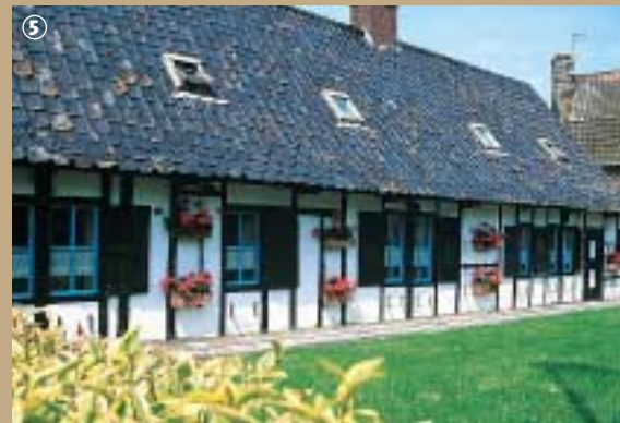
Maison flamande à Terdeghem.

la tuile romaine. Son autre originalité est sa couleur : elle réchauffe l'atmosphère ambiante de ses tons rouge orangé et noir